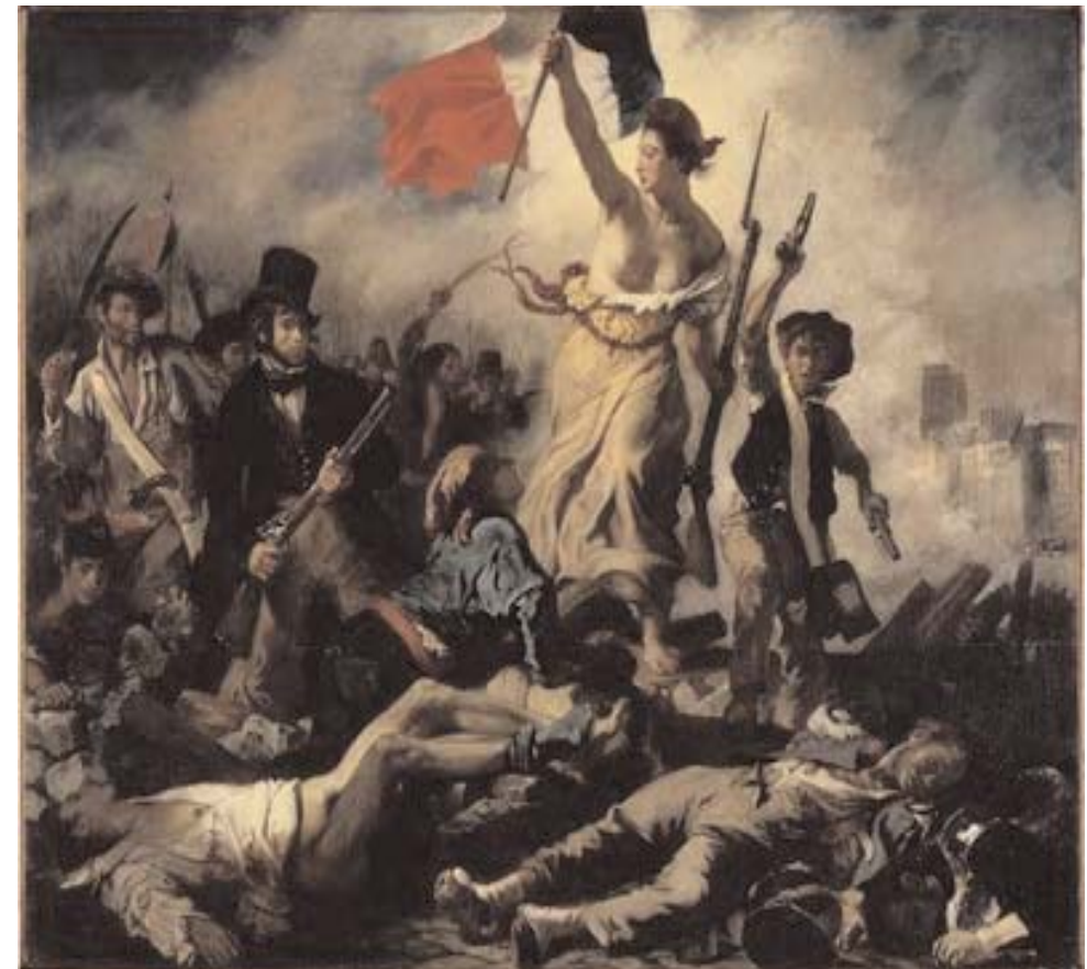
la Liberté guidant le peuple, Delacroix, 1830