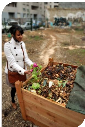
© Josselin JALLADEAU – Université Jean Moulin Lyon 3