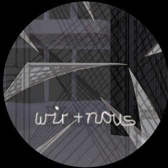
Relations d'un réseau

sur le thème « Le duo franco-allemand : hier, aujourd'hui et demain »