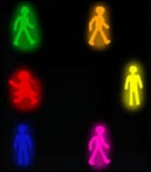
La vie des nôtres