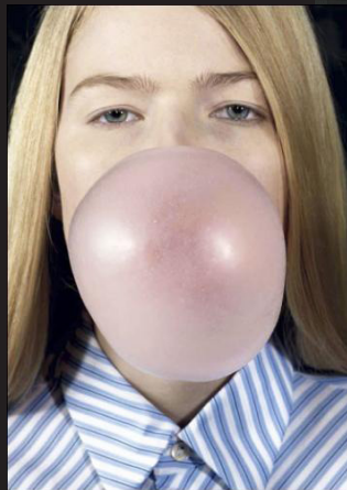
* Roe Ethridge