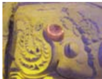
Saint-Georges les sept voies (49)