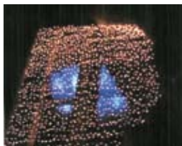
Villard de Lans (38)