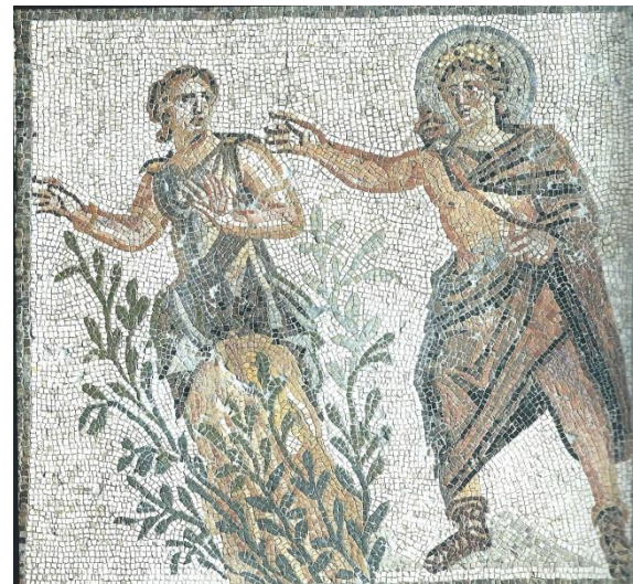
Mosaïque d'Apollon et Daphné. Maison de Ménandre