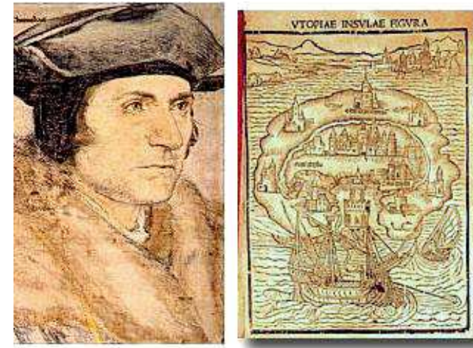
Thomas More et son Utopia